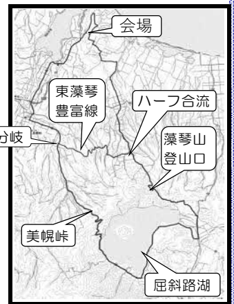
(コースレイアウト図)