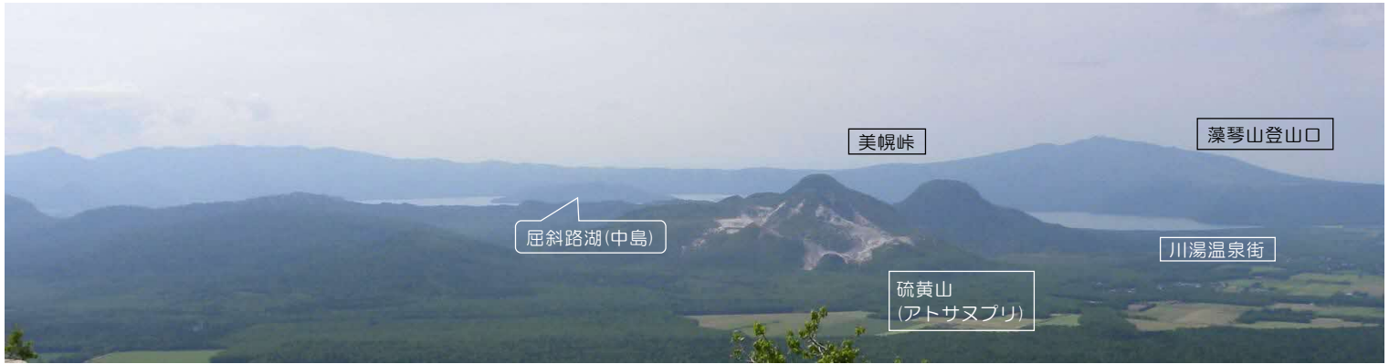
阿寒摩周国立公園(摩周湖第3展望台)から望むコース(美幌峠・藻琴山登山口)方向