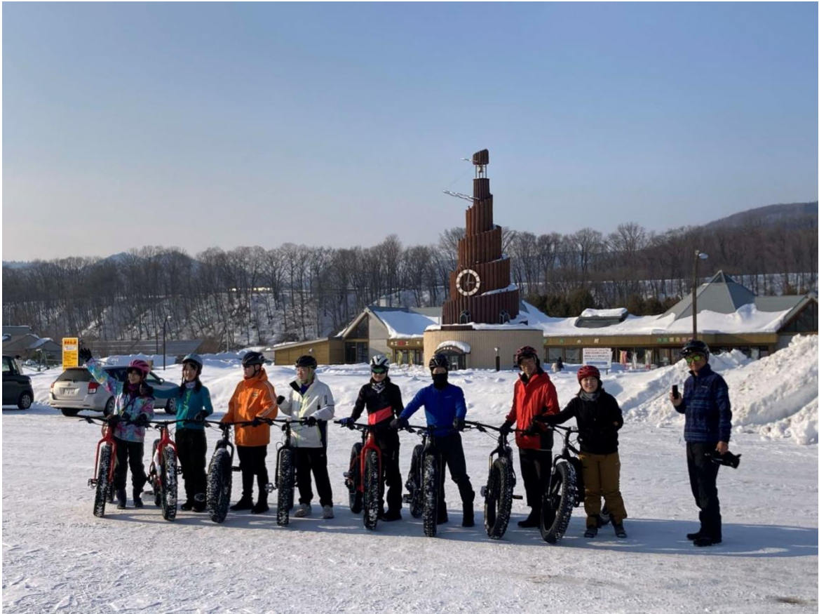
(令和4年度開催スタート風景)